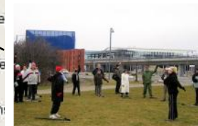
Selve gåturen starter og slutter ved indgangen til fælleden. Det er også her vi har vores udstyr i en container.