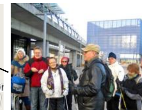
Vi samles ved stationen